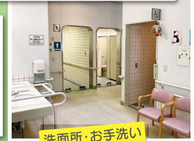
洗面所・お手洗い