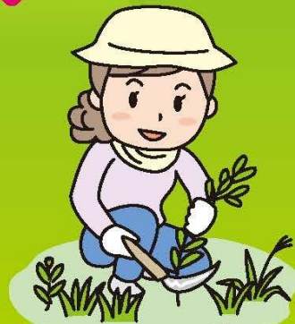
ちょっとした草取り