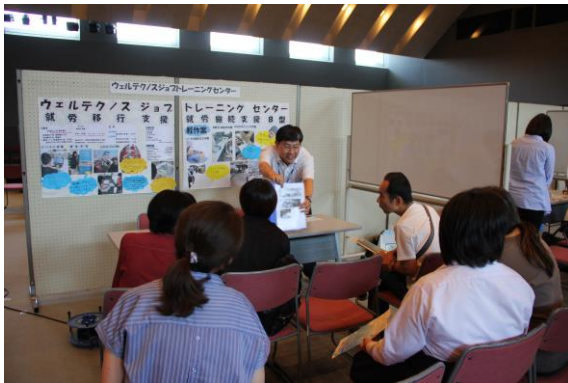
事業所ブースの様子。皆さま熱心に説明を聞いていました。

8月2日(木)に、大垣市情報工房セミナー室・スィンクホールにて『事業所紹介フェア』を開催しました。市内の就労移行支援事業所、就労継続支援A型・B型事業所が参加し、ブースごとに事業所の特色や仕事内容等について説明を行いました。