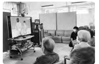
【昨年度の講座の様子】