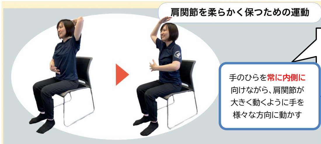
肩関節を柔らかく保つための運動