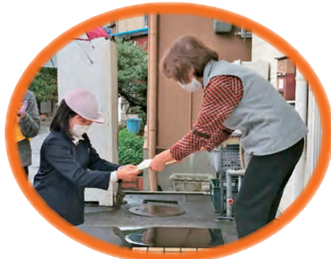
昨年度 歳末友愛訪問の様子

また、地域のふれあいづくりを目的とした事業にも募金が活用されています。ご協力をお願いします。