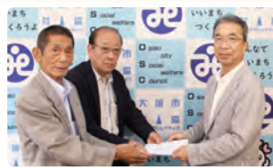
静里かがやきクラブ連合会 41,597円