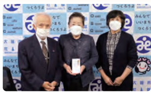
三城日赤奉仕団 53,045円

次の皆さまからご寄付をいただきました。ありがとうございました。《9/1～11/25》(順不同、敬称略)